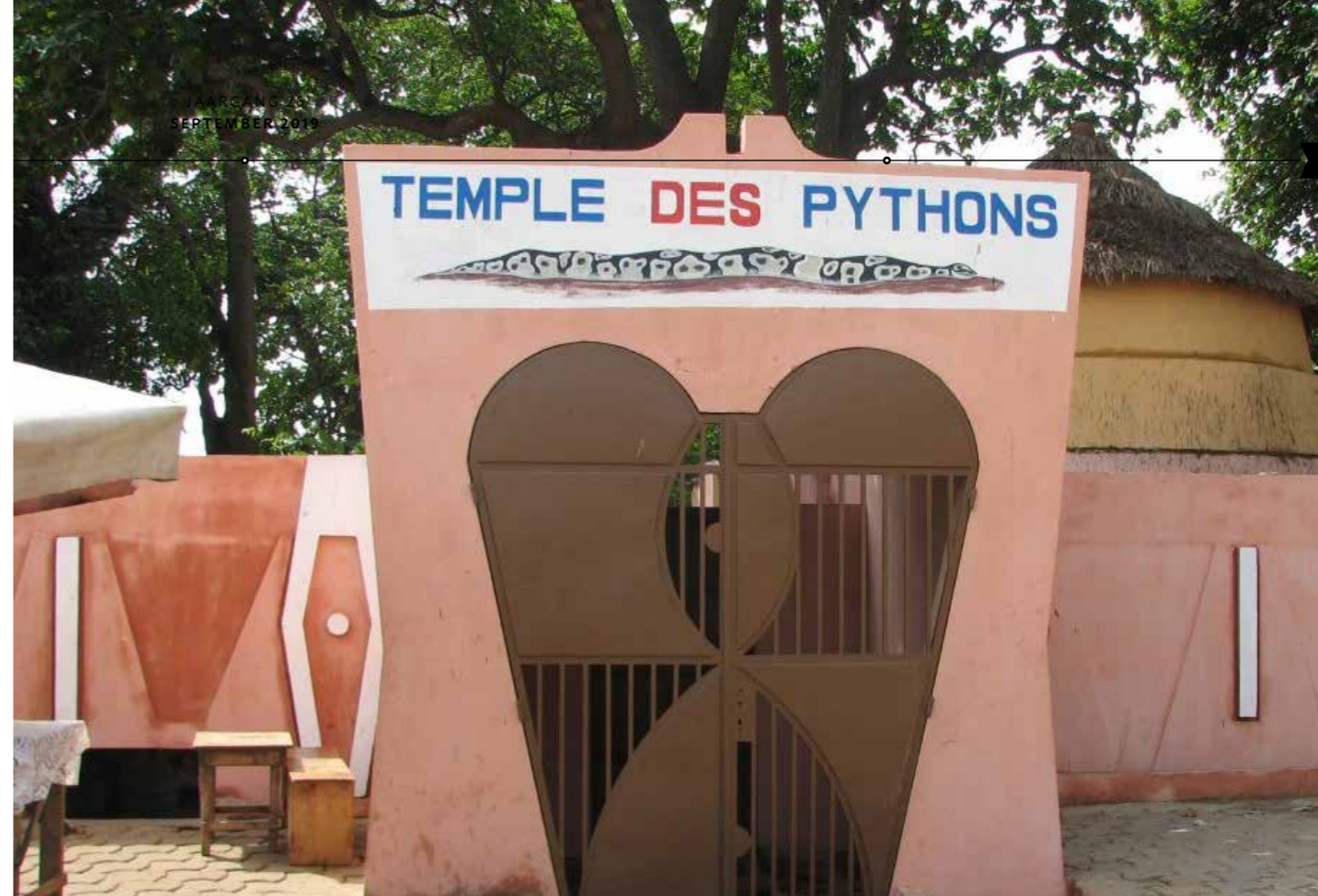
Temple des Pythons in Benin

In de gemeente van Cotonou in Benin komt nu een jonge vrouw van begin 20. Ze is getrouwd en heeft een klein kindje. Met haar toestemming geef ik haar verhaal door: 'Ik ben opgegroeid in een gezin waar veel aan voodoo werd gedaan (met hun Temple des Pythons). Vandaar dat